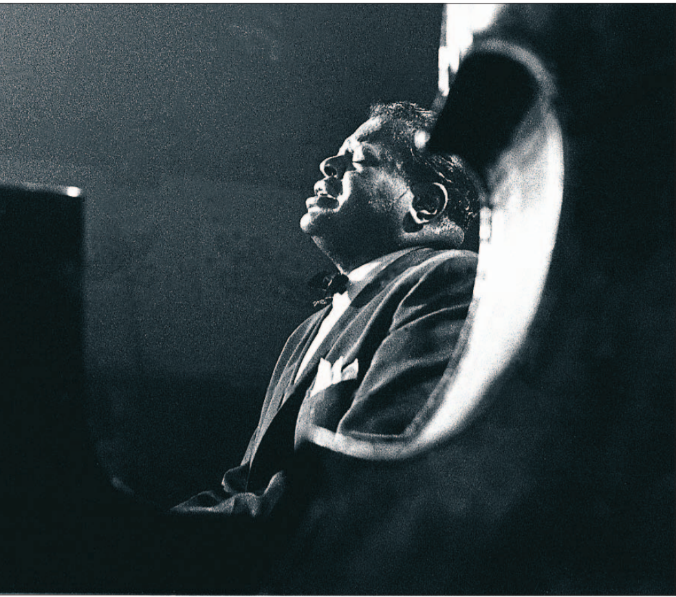
EN EKSTATISK Oscar Peterson ved klaveret, knipset i Holbæk Jazzklub.