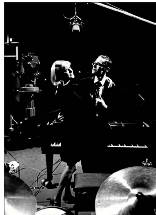
DEN SVENSK sangerinde Monica Zetterlund og pianisten Bill Evans indledte samarbejdet med lp'en "Waltz for Debbie" i 1964. To år senere var de i tv-studiet i København og fejrer det her med en stille vals.