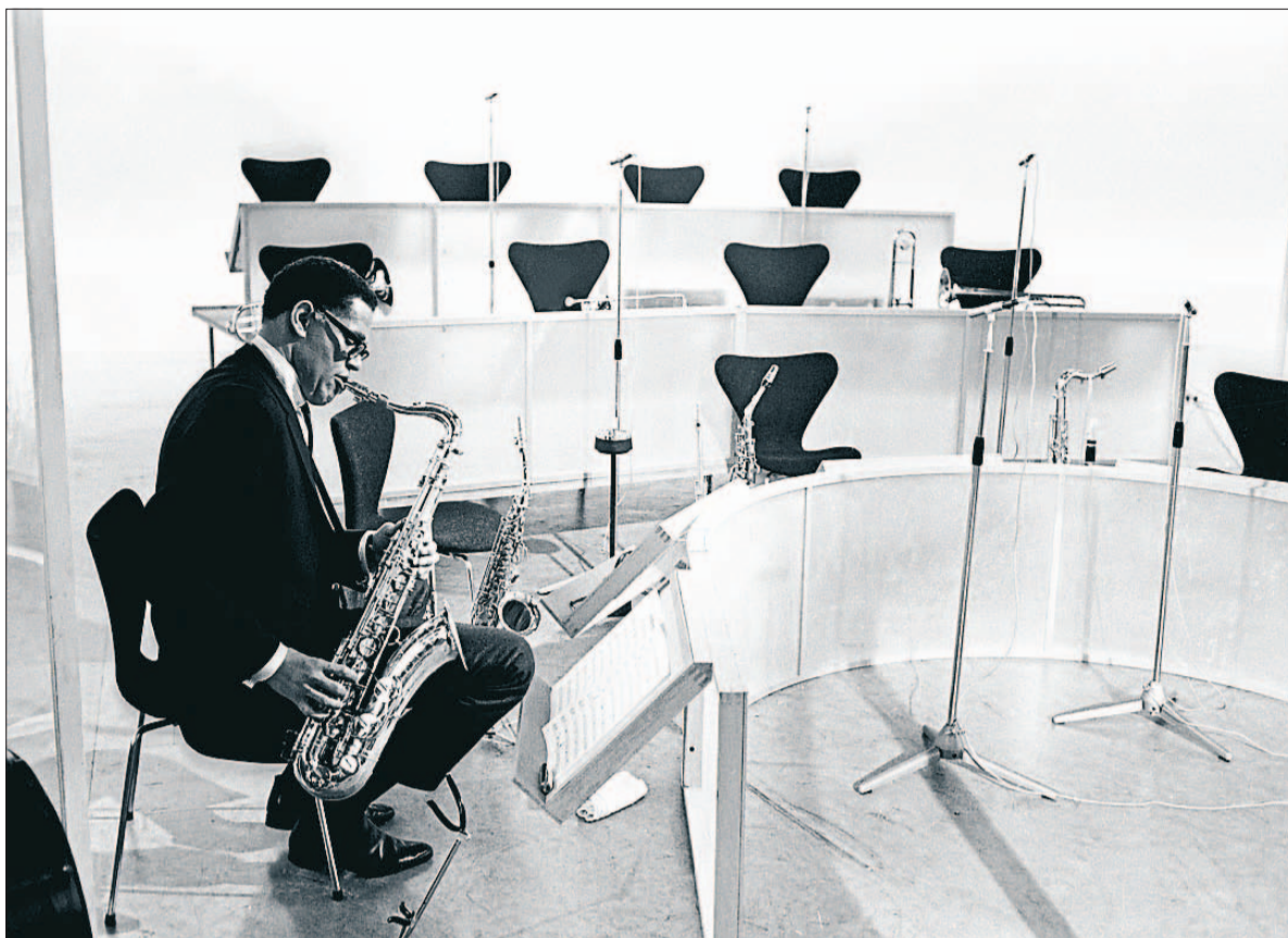
LONG TALL Dexter. Tenorsaxofonisten Dexter Gordon fanget i en stille arbejdsstund.