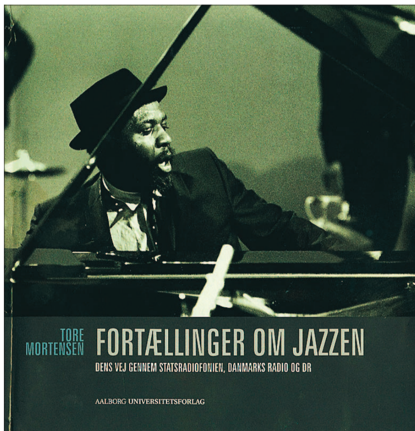
PÅ BOGENS forside er pianisten Thelonious Monk fanget i Danmarks Radios tv-studie i 1966.

hva' laver Henry Kissinger her? - og anbefales varmt både for sit kulturpolitiske, meget præcise snit, men specielt for alle de gode historier, som der også blev plads til.