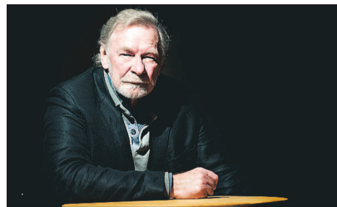
Jazzfotograf Jan Persson arbejder stadig på at få de bedste af yderligere 7000 negativer digitaliseret.

De tilgængelige fotos - flere end 14.000 - er alle bearbejdet og digitaliseret af Jan Persson selv, og online samlingen vil de kommende år