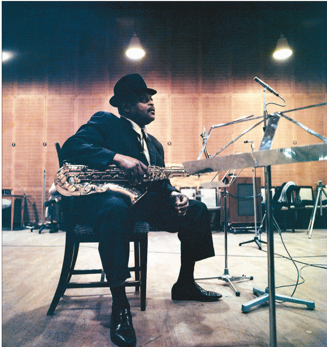
Den amerikanske tenorsaxofonist Ben Webster (1909-1973) fanget i en stille stund i Radiohusets studie.