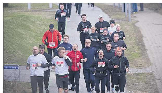
Aalborg Øst Road Runners, der blandt andet stod bag New Balance Halvmarathon, hvorfra billedet stammer, har fået penge til forbedring af sine faciliteter - blandt andet overdækning og el.

ning m. fl., så der ligger endnu ingen indflytningsdato.