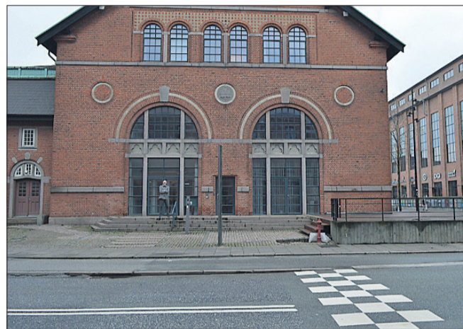
Jazzcentrets kommende beliggenhed i forsyningens lokaler på Østerbro 9.

- At holde flyttedag for et af de mest uvurderlige og righoldige jazzarkiver i Europa er en kompliceret opgave rent logistisk. Det er vigtigt at sikre, at intet går