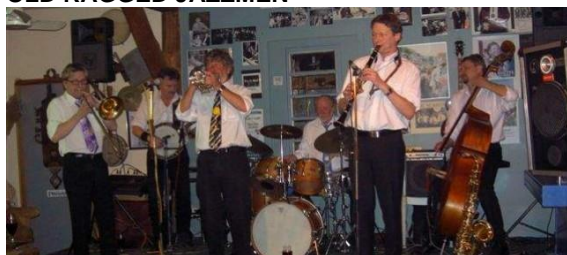
Old Ragged Jazz Men på Jazzklubben Malurt