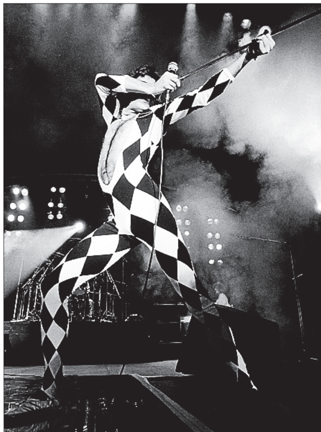
Forsanger Freddie Mercury fra Queen på scenen i 1977.