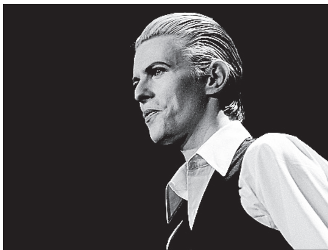
David Bowie fotograferet i april 1976 under hans "Thin White Duke"-periode.