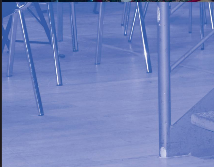
Center for Dansk Jazzhistorie