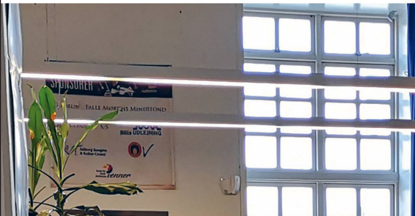
Det Jyske Musikonservatorium.